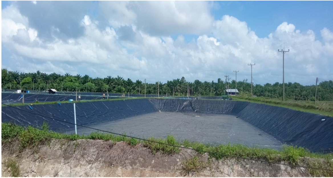
ภาพ : บ่อเลี้ยงกุ้งที่มีการปูพลาสติกสีดำ

เมื่อป้อนน้ำกร่อยจากแหล่งน้ำธรรมชาติมาไว้ในบ่อพักน้ำ ๓ -๕ วัน จะป้อนน้ำมายังบ่อที่ปรับปรุงคุณภาพน้ำจำนวน ๒ บ่อ โดยมีบ่อรวมน้ำดีเป็นจุดกลางที่ทำให้น้ำในบ่อปรับปรุงคุณภาพน้ำมีปริมาณน้ำที่เท่ากัน และปล่อยน้ำที่ปรับปรุงคุณภาพน้ำแล้วไปยังบ่อเลี้ยงกุ้งผ้าใบทั้ง ๔ บ่อ ในบ่อรวมน้ำดีจะมีไขหอยและสิ่งมีชีวิตในน้ำกร่อยมาตกค้างและเติบโตในบ่อรวมน้ำดี หากไม่ได้นำหอยและตะกอนออกจากบ่อรวมน้ำดีจะทำให้มีการทับถมของหอยและสิ่งมีชีวิตที่ตายทำให้เกิดก๊าซไฮโดรเจนซัลไฟด์และก๊าซแอมโมเนีย โดยปกติในการเลี้ยงกุ้งตั้งแต่เตรียมบ่อจนจับกุ้งใช้เวลา ๖ เดือน ทำให้ต้องล้างบ่อรวมน้ำดีทุก ๖ เดือน