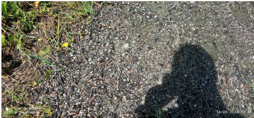
ภาพ : ชากหอยและเศษตะกอนที่ตัดขึ้นมาจากก้นบ่อ

- ข้อมูลด้านการบริหารและจัดการด้านความปลอดภัยฯ บริษัทฯ ได้มีการบริหารและจัดการด้านความปลอดภัยฯ ดังนี้