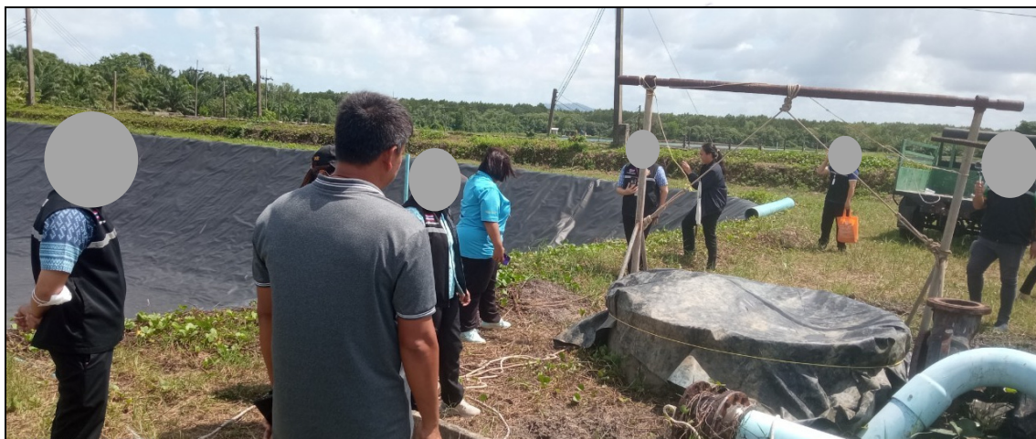
ภาพ : เจ้าหน้าที่เข้าตรวจสอบสถานที่เกิดอุบัติเหตุ

วันที่ ๑๕ มิถุนายน ๒๕๖๗ สำนักป้องกันควบคุมโรคที่ ๑๑ จังหวัด น สำนักงานสาธารณสุขจังหวัด ร สำนักงานสาธารณสุขอำเภอเมือง ร โรงพยาบาล ร โรงพยาบาลส่งเสริมสุขภาพตำบล ห เทศบาลตำบล ร และสถานีตำรวจภูธรตำบล ร เข้าตรวจสอบหาสาเหตุในพื้นที่เกิดเหตุ โดยทำการตรวจวัดก๊าซภายในบ่อที่เกิดเหตุ ทุกๆ หนึ่งเมตรจากปากบ่อ จนถึงผิวน้ำก้นบ่อ ทั้งก่อนกวนและหลังกวนตะกอนด้วยแท่งเหล็ก ซึ่งเป็นการจำลองสถานการณ์ให้มีลักษณะใกล้เคียงขณะเกิดเหตุที่ลูกจ้างตักโกยตะกอนที่ก้นบ่อ