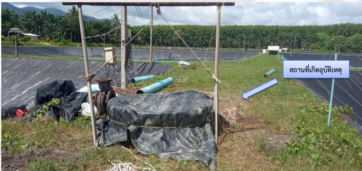
ภาพ : บ่อรวมน้ำดี และสถานที่เกิดอุบัติเหตุ

เมื่อป้อนน้ำกร่อยจากแหล่งน้ำธรรมชาติมาไว้ในบ่อพักน้ำ ๓ -๕ วัน จะป้อนน้ำมายังบ่อที่ปรับปรุงคุณภาพน้ำจำนวน ๒ บ่อ โดยมีบ่อรวมน้ำดีเป็นจุดกลางที่ทำให้น้ำในบ่อปรับปรุงคุณภาพน้ำมีปริมาณน้ำที่เท่ากัน และปล่อยน้ำที่ปรับปรุงคุณภาพน้ำแล้วไปยังบ่อเลี้ยงกุ้งผ้าใบทั้ง ๔ บ่อ ในบ่อรวมน้ำดีจะมีไขหอยและสิ่งมีชีวิตในน้ำกร่อยมาตกค้างและเติบโตในบ่อรวมน้ำดี หากไม่ได้นำหอยและตะกอนออกจากบ่อรวมน้ำดีจะทำให้มีการทับถมของหอยและสิ่งมีชีวิตที่ตายทำให้เกิดก๊าซไฮโดรเจนซัลไฟด์และก๊าซแอมโมเนีย โดยปกติในการเลี้ยงกุ้งตั้งแต่เตรียมบ่อจนจับกุ้งใช้เวลา ๖ เดือน ทำให้ต้องล้างบ่อรวมน้ำดีทุก ๖ เดือน