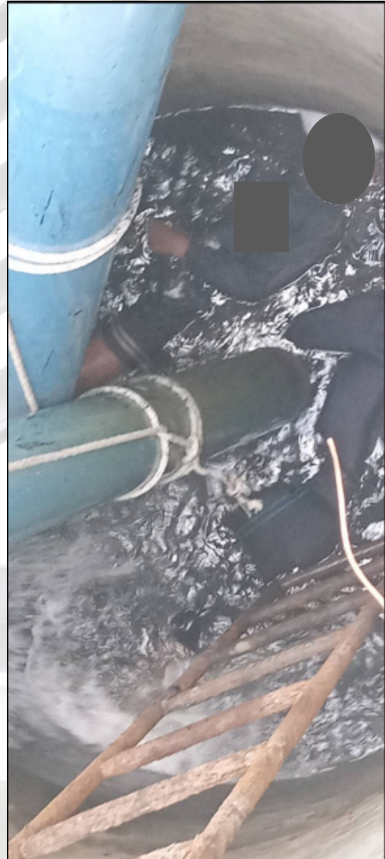
ภาพ : ลูกจ้างผู้เสียชีวิต