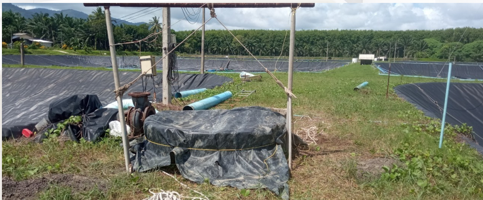
ภาพ : บ่อรวมน้ำดี